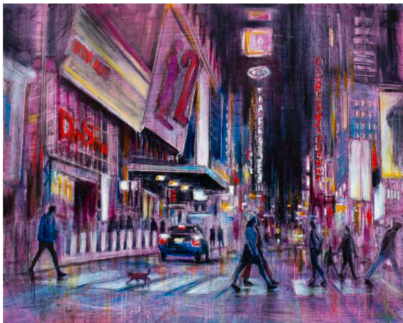
CRONACHE METROPOLITANE DI UN GATTO ROSSO, 2025 olio, pigmenti e smalti su tela cm 40x50