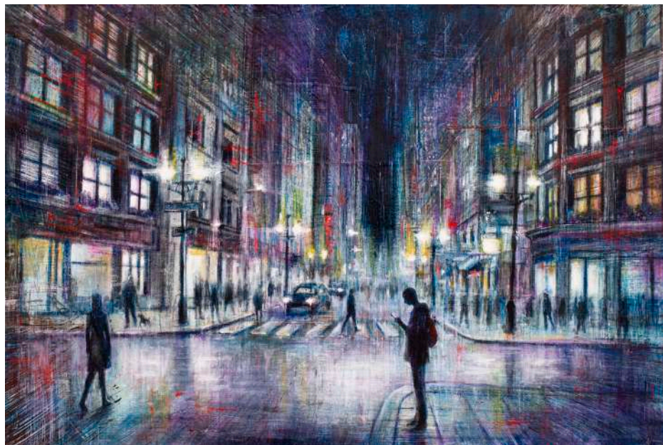
SLIDING DOORS, 2025 olio, pigmenti e smalti su tela cm 40x60