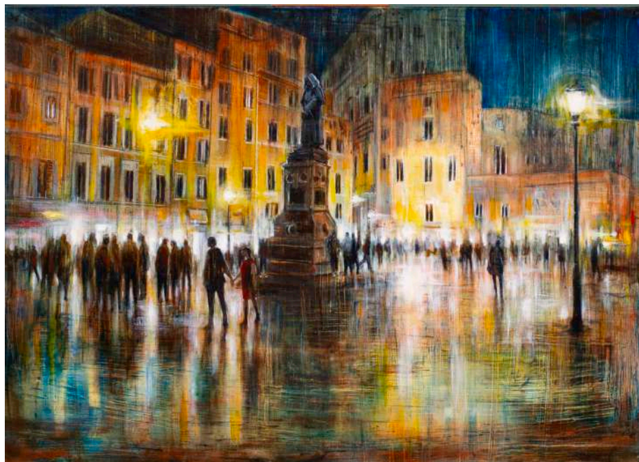
CAMPO DEI FIORI, 2025 olio, pigmenti e smalti su tela cm 50x70