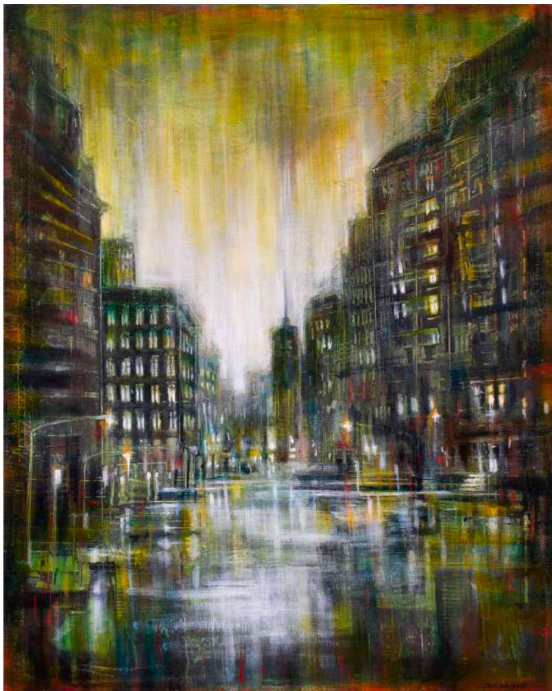
CITY, 2024 olio, pigmenti e smalti su tela cm 50x40