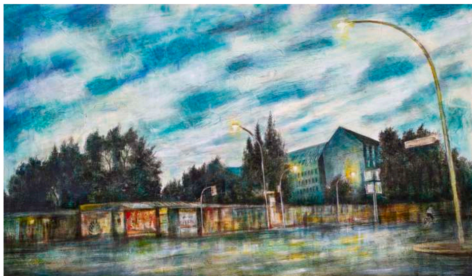
EAST SIDE GALLERY (BERLINO), 2021 olio, pigmenti e smalti su tavola cm 70x126