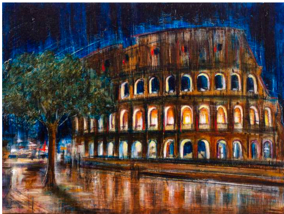
COLOSSEO, 2025 olio, pigmenti e smalti su tela cm 30x40