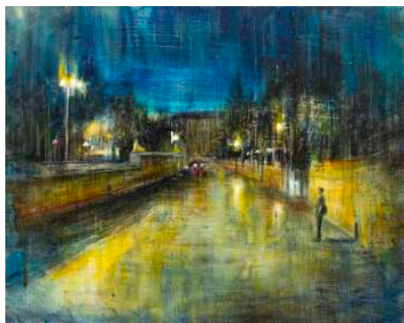
A ROMA, 2020 olio, pigmenti e smalti su tela cm 40x50

titolo della mostra, Urbis somnia , la volontà dichiarata dell'artista è sicuramente quella di comporre, nel solco della sua ormai nota sensibilità, un percorso tra le atmosfere notturne della città, luogo che, nelle luci e nei gesti, diventa oggetto di sogni e allo stesso tempo soggetto sognante.