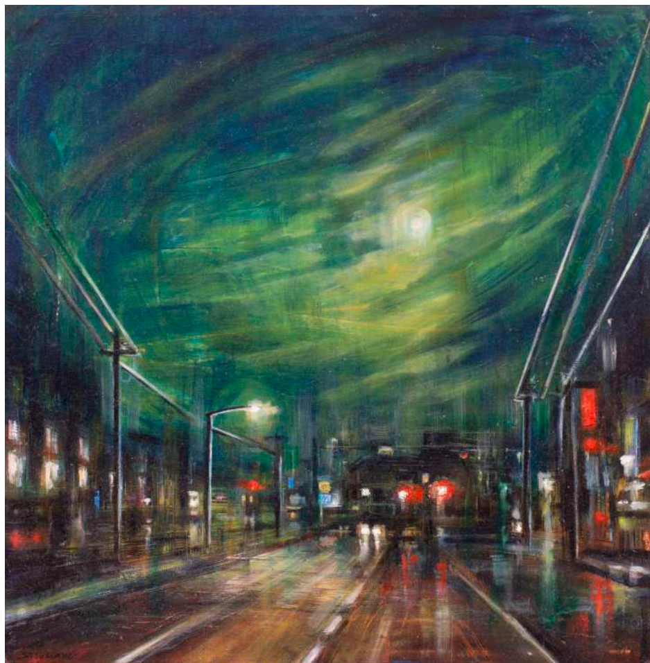
NOTTURNO, 2022 olio, pigmenti e smalti su tela cm 40x40