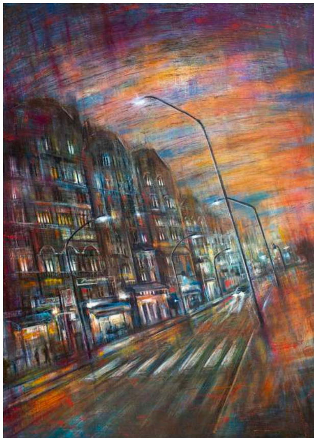
ALTROQUANDO, 2021 olio, pigmenti e smalti su tela cm 100x70