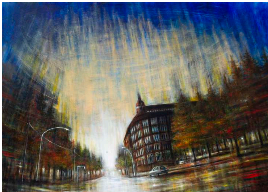
SINFONIA D'AUTUNNO, 2023 olio, pigmenti e smalti su tela cm 110x155