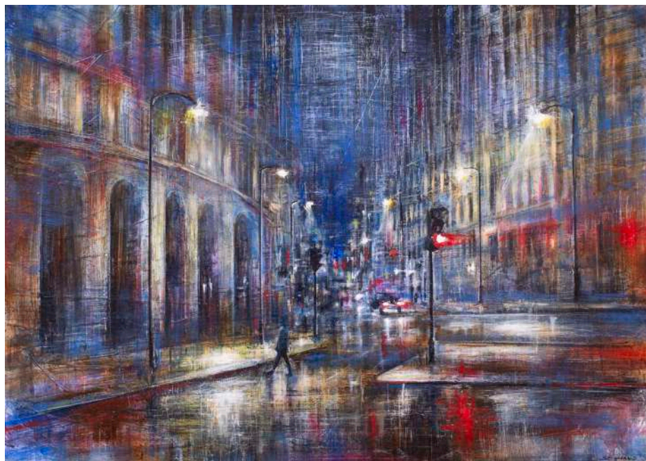
NEL ROSSO, 2021 olio, pigmenti e smalti su tela cm 50x70