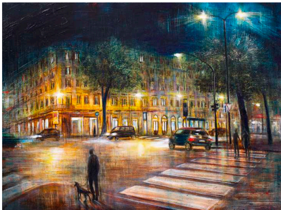
PERCORSI DI LUCE, 2025 olio, pigmenti e smalti su tela cm 60x80