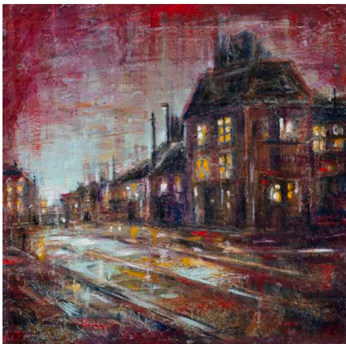
VERSO SERA, 2021 olio, pigmenti e smalti su tela cm 20x20