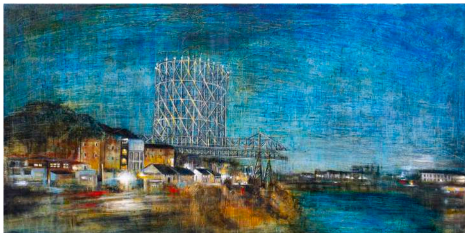
GAZOMETRO, 2025 olio, pigmenti e smalti su tela cm 60x120