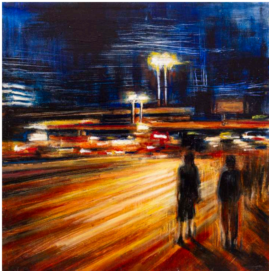
PASSEGGIATA NOTTURNA, 2021 olio, pigmenti e smalti su tela cm 40x40