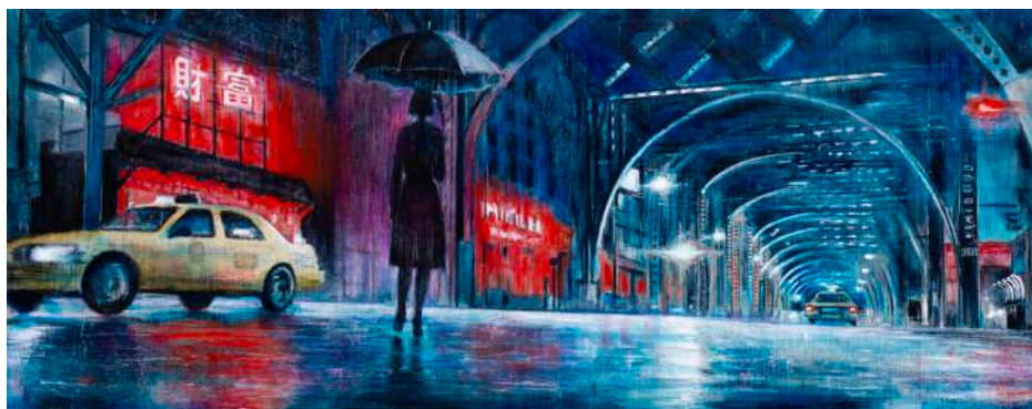
IN UN GIORNO DI PIOGGIA, 2025 olio, pigmenti e smalti su tela cm 40x100