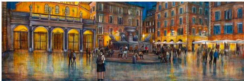
PIAZZA DI SANTA MARIA IN TRASTEVERE, 2025 olio, pigmenti e smalti su tela cm 50x150