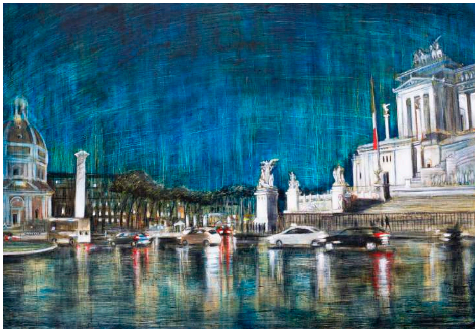
PIAZZA VENEZIA, 2025 olio, pigmenti e smalti su tela cm 70x100