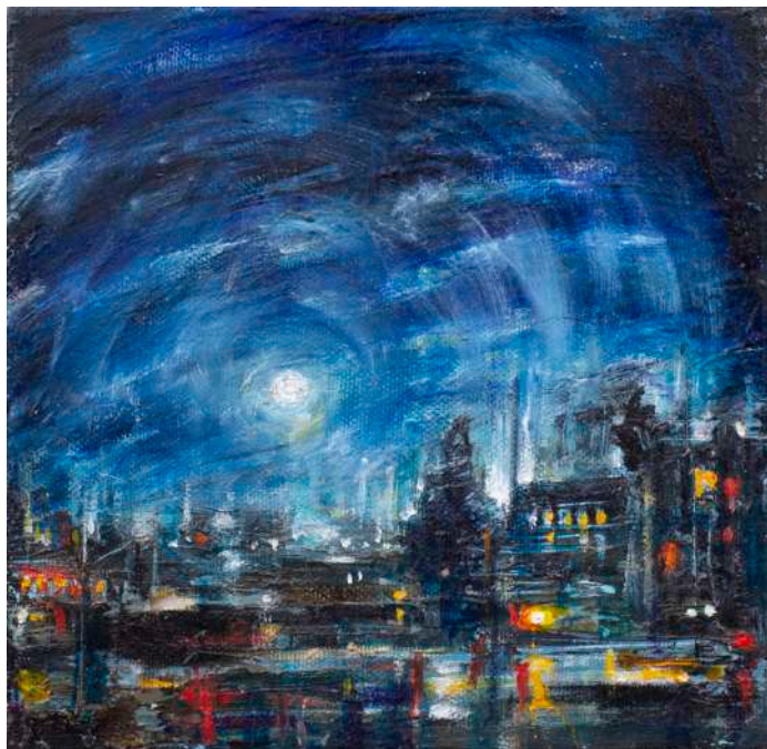
LUNA PIENA, 2021 olio, pigmenti e smalti su tela cm 20x20