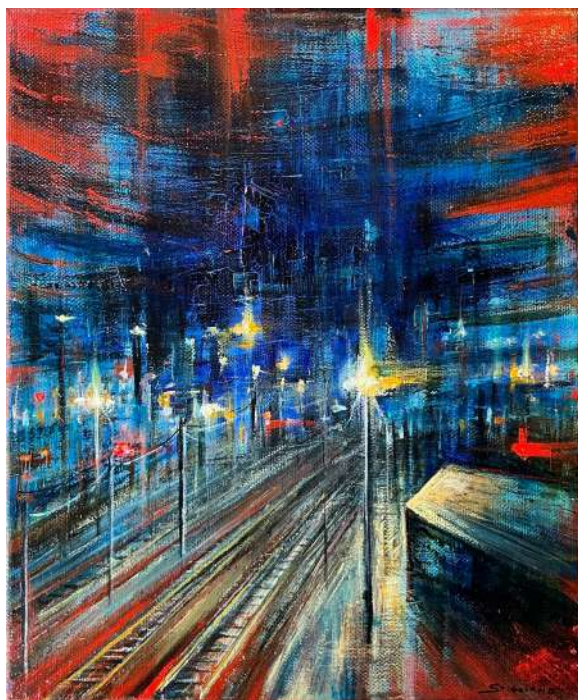
STATION, 2024 olio, pigmenti e smalti su tela cm 30x25