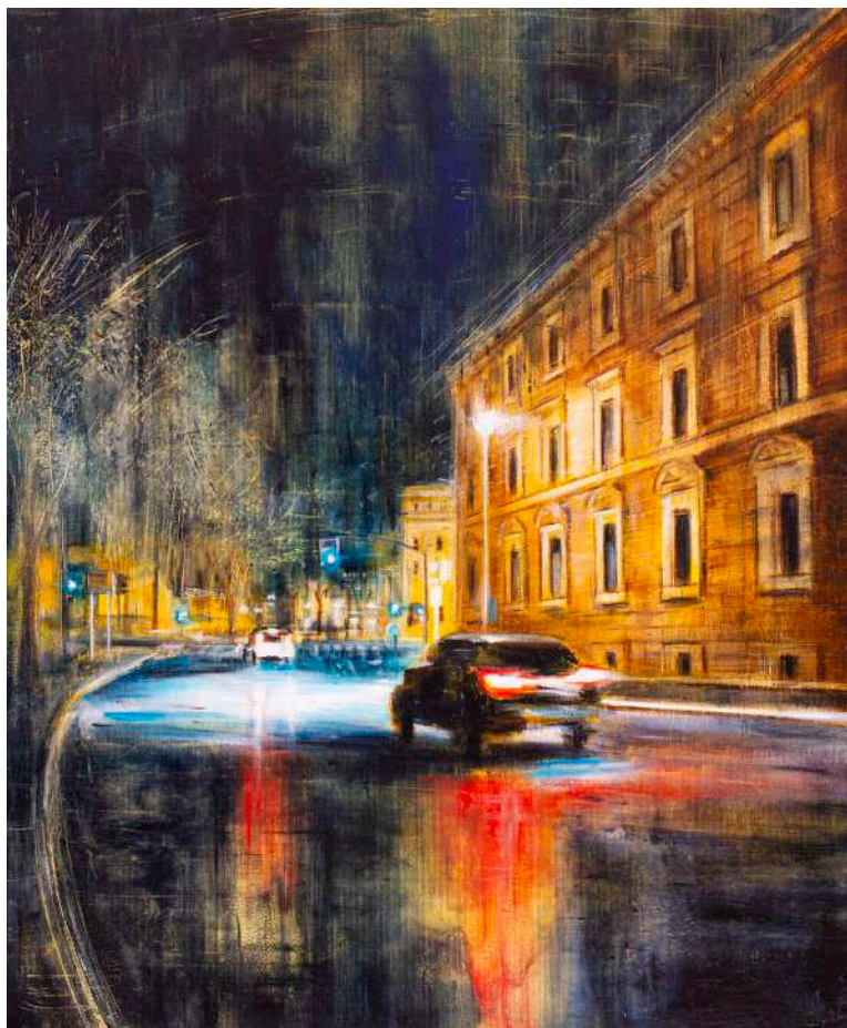
LUCI NOTTURNE, 2025 olio, pigmenti e smalti su tela cm 60x50