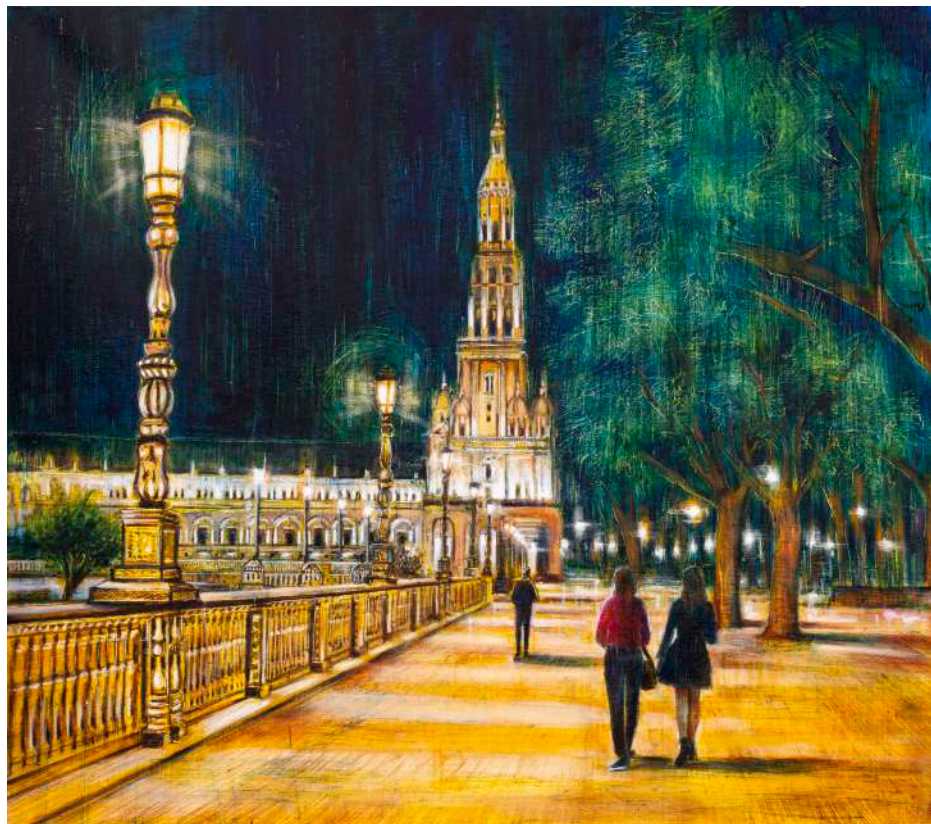
PIAZZA DI SPAGNA (SIVIGLIA), 2025 olio, pigmenti e smalti su tela cm 70x80