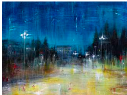
DI NOTTE, 2019 olio, pigmenti e smalti su tela cm 30x40

In queste opere la presenza umana prostra la propria individualità al cospetto della dimensione storico-urbana circostante, cede ogni protagonismo e le storie del singolo si fanno corale partecipazione a un principio più comunitario di cui la città è artefice.